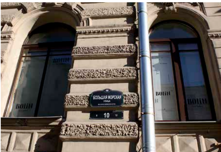
Ett minne av den berömda juvelerarfirman W A Bolin finns kvar i St Petersburg. Namnet står fortfarande i fönstren.