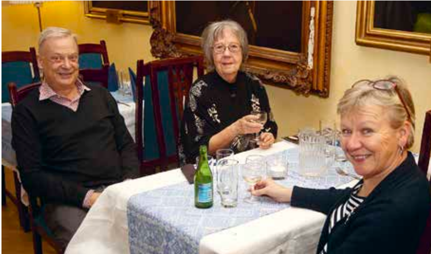
I väntan på VSFs föredrag och frågetävlingen.

Det haglade frågor från publiken och VSF hade stort tålamod med att besvara alla så gott det nu gick. När man har trevligt går kvällen fort och det blev dags för uppbrott.