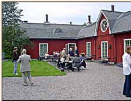
Kaffestund vid gästgiveriet