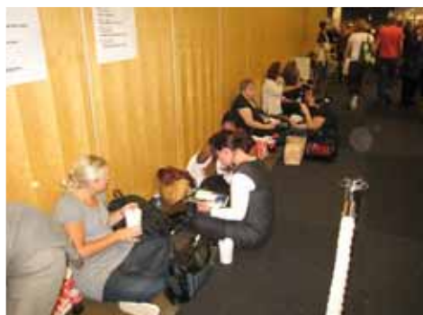
Kö till VSF seminarium