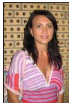
Den riktiga drottningen Camilla