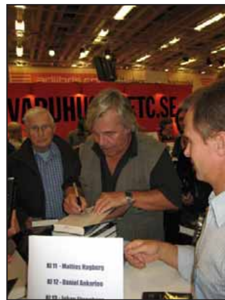
Jan Guillou skriver inte deckare säger han