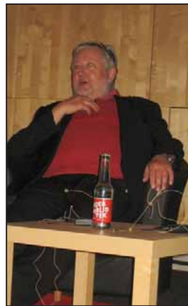
Leif GW Persson, som alltid nöjd med sina böcker

Enligt Wikipedia är deckare eller kriminalberättelse en populärkulturell genre vars verk har som huvudtema att skildra ett eller flera brott, som läsaren ofta länge är ovisst om vem som har begått. Genren finns som roman, novell, spelfilmer, TV-serie och tecknad serie. Ordet deckare har sitt ursprung ur ordet detektiv, eftersom huvudpersonen är ofta en privatdetektiv, men berättelsen kan också kretsa kring en kriminalpolis eller någon annan problemlösare (journalist, präst, psykolog och många flera), eller till och med kring en gärningsman.