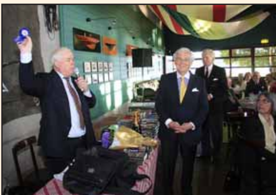
VSF mottar ordnar av ordföranden