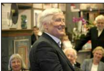
VSF ler belåtet