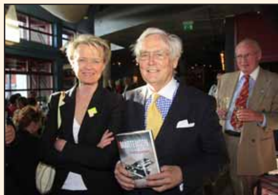
VSF med Blomma och bok