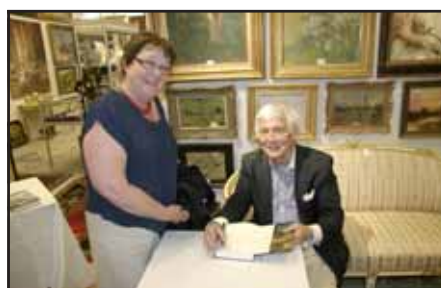
VSF med beundrarinna