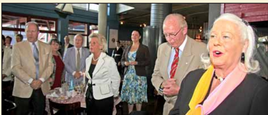
VSF sånghyllas Ja må han leva