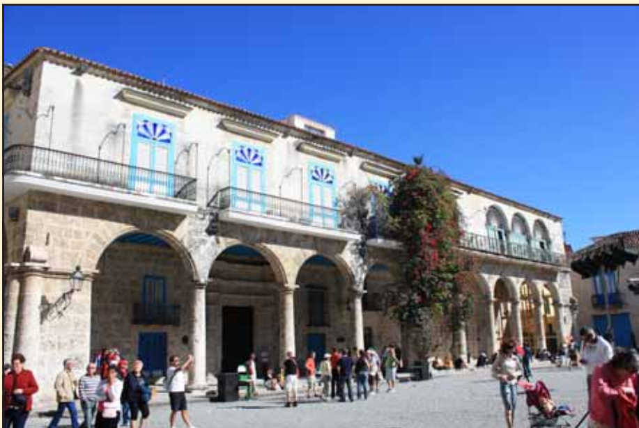
Gamla stan i Havanna. Vissa byggnader är vackert restaurerade.