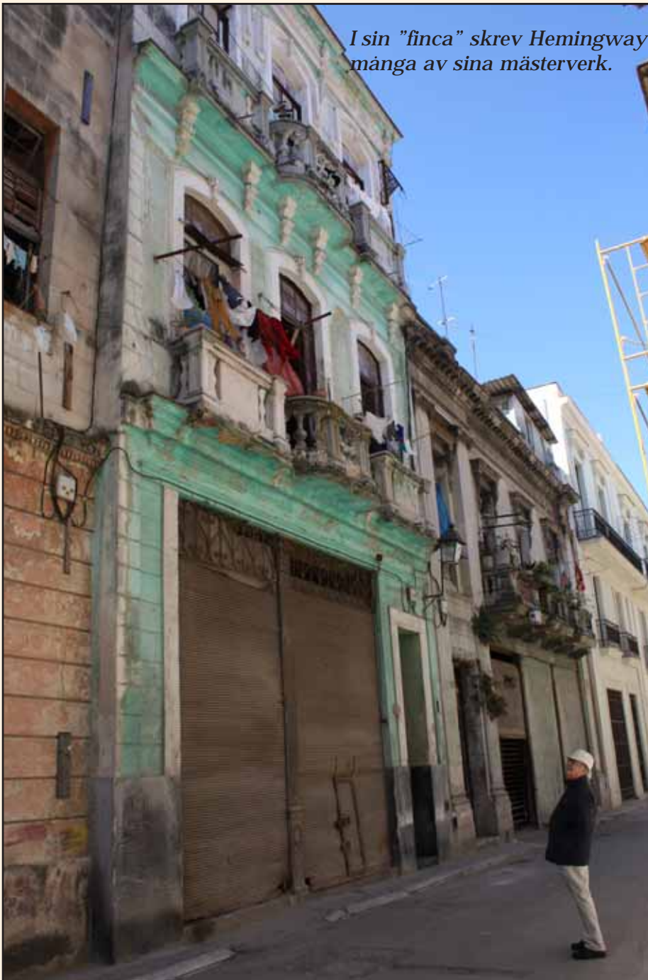
Bristen på underhåll sätter tydliga och sorgliga spår.

I sin "finca" skrev Hemingway många av sina mästerverk.