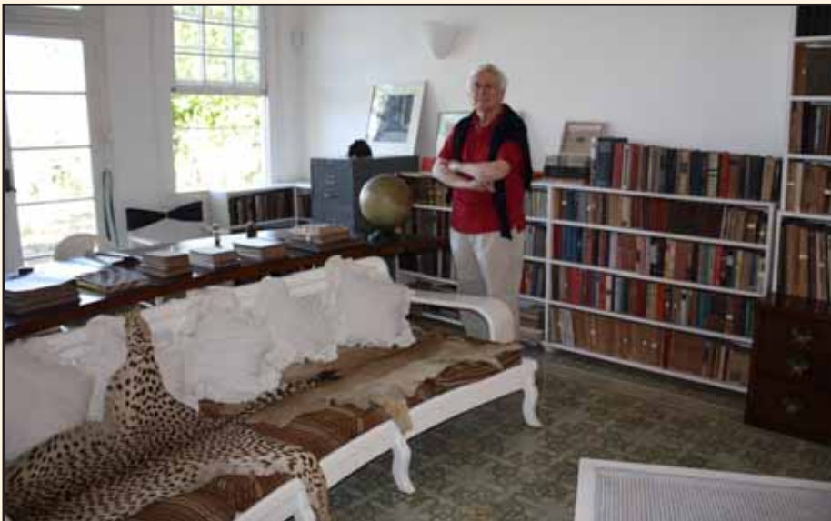
I mitt vardagsrum finns inga leoparder.