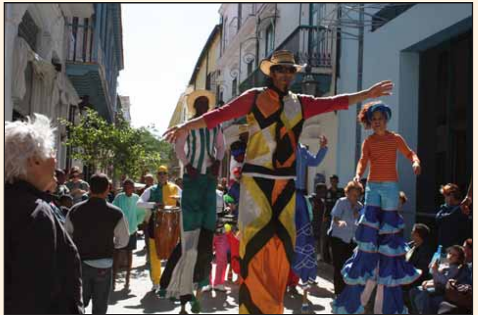
Musiken fyller Havanna och hela Cuba med liv.