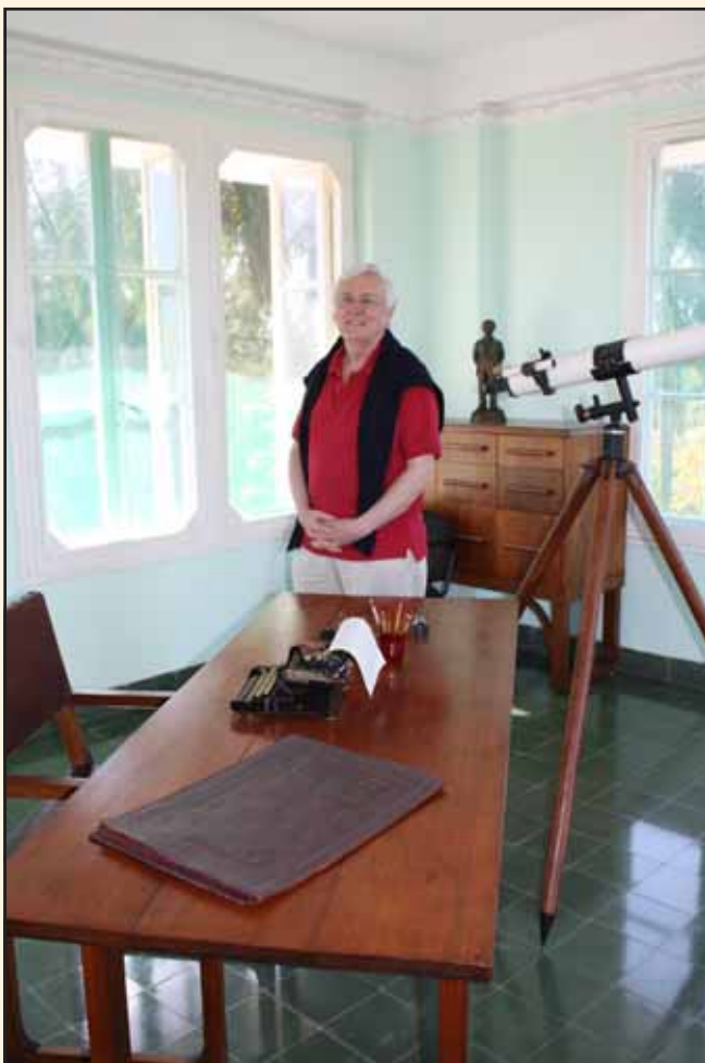
Vid kollegans skrivmaskin.