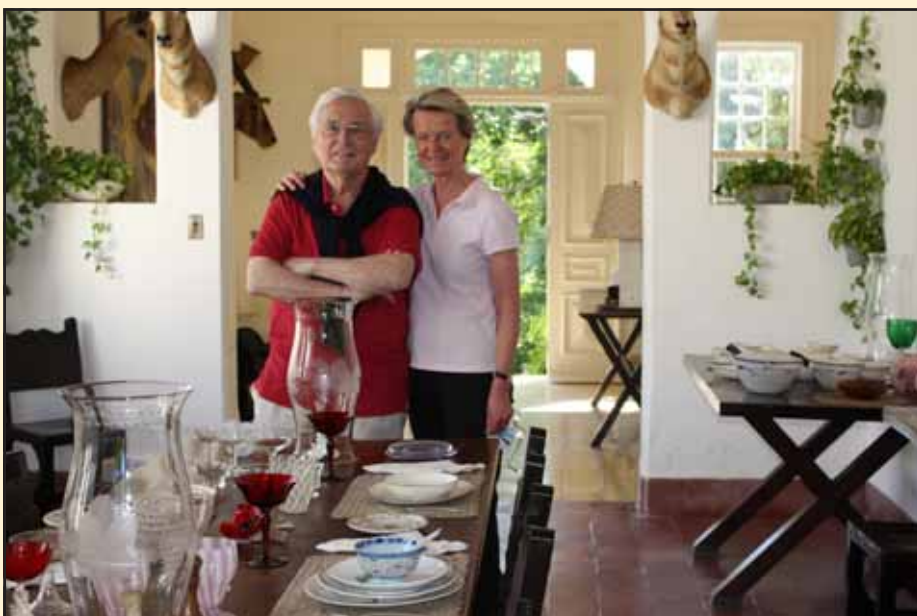
Lunch hos Hemingway. Tyvärr kunde värden inte vara med.